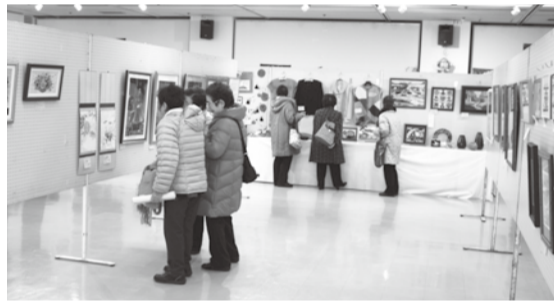
素敵な作品をたくさん出展いただきました