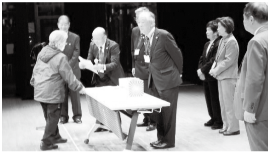
お楽しみ抽選会で見事当選されました!!