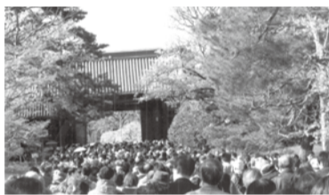
平成最後の桜の乾門通り抜け