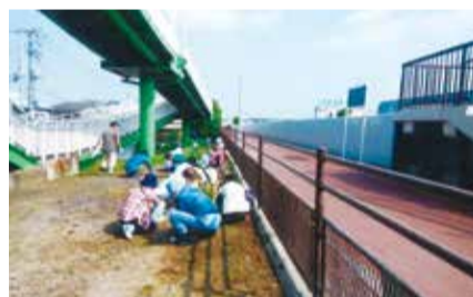
一斉美化運動のようす

父路〜長瀬を歩いてきました。年々、長距離を歩くのが難しくなっていますが、楽しい一日を過ごすことができました。 これからも地域の皆さんと楽しく交流を深めていきたいと思っています。 ほとんどが参加するなど、クラブをあげて貢献しています。また、新規会員募集も会長と各班の班長と一緒に訪問するなどして積極的に行っています。その活動が功を奏して昨年の4月には12名が新たな会員となりました。今後も活動内容の工夫や新規会員募集をとおして、よりクラブ全体が盛り上がるよう努力していきます。