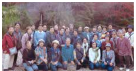
長瀬での日帰り研修にて

手伝いをしたりしています。近くに宇喜田さくら公園という大きな公園があるので、身近に季節の行事を楽しむことができます。 また、数年前より7月になると宇喜田小学校の子ども達に盆踊りを教えるボランティアをしています。子どもたちの元気な声に私たちも若返らせてもらい、夏祭り当日には一緒に盆踊りを踊ったり、ダンスや太鼓を見せてもらったりと交流を深めました。 この他にも活動は盛りだく