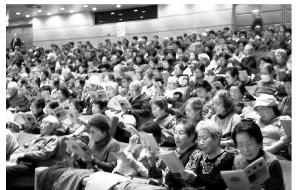
歌声が大ホールに響き渡りました

★★★★ 私たちは江戸川区くすのきクラブ連合会の活動を応援しています。【西部版】★★★★