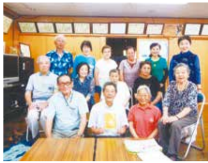
「環境をよくする運動」にて

私たちの第二長命会は、会員数が100名を超える比較的大きなクラブで、主に長島会館や長島桑川コミュニティ会館で活動しています。クラブ活動を円滑に進められるよう、定例会を毎月2回実施し、理事会の報告等をして役員と一般会員との間で情報共有しています。 クラブ活動の一つ、リズム運動は毎週月曜日に開催しており、15名ほどの会員が参加しています。 また、毎月10日に実施している誕生会は、近隣に「長命会」と名のつくクラブが当クラブを含め4クラブあるため、合同で実施しています。毎回、