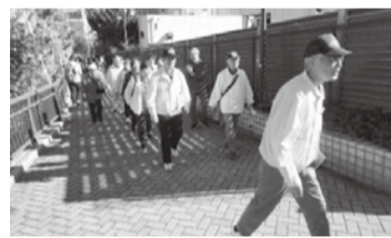
ウォーキングフェスタエどがわ