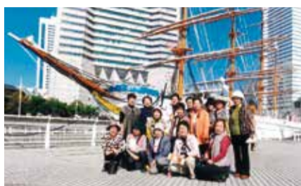
横浜での日帰り旅行

私たちのクラブ活動における大きな特徴は、町会や小学校といった地域と密接にかかわっているという点です。町会長さんをはじめ、役員の方々も私たちのクラブ