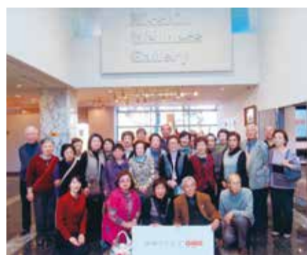
横浜の日清オイリオ工場にて

クラブ内の活動においても会員同士の親睦を深めるため、毎年日帰り研修および宿泊研修を企画しています。日帰り研修では横浜の日清オイリオ工場を、宿泊研修では群馬の猿ヶ京温泉をそれぞれ訪れ、会員皆が楽しんでいました。