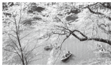
千鳥がふちの桜(北の丸公園より撮影)

先月、皇居・乾通りの桜を見てきました。当日は大勢の花見客でにぎわっており、各々春の訪れを楽しんでいました。