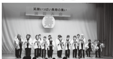
笑顔いっぱい長寿の集い