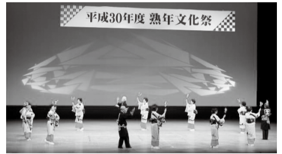
日頃の練習の成果を披露しました