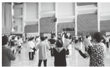
リズム運動地区交流会