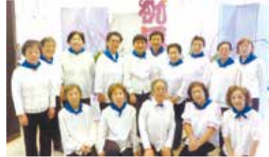
「笑顔いっぱい長寿の集い」に参加

私たちの宇喜田交友会は、中組町会と十四軒自治会の2団体から成り立っており、今年で45年目を迎えました。男性会員が少なく女性主体の会ですが、地域の皆さんと交流をもちながら、楽しく活動しています。 リズム運動は月に4回、メゾン北葛西集会室を借りて練習しています。毎回、丁寧に教えてくださるので、1回に35〜 40名が集まり賑やかです。体調不良で運動には参加できなくても、顔を見に来て帰られる会員さんもいます。リズム運動の後、合唱祭の練習をすることもあり、大きな声で歌うことは「いいね〜！」と言いな 「笑顔いっぱい長寿の集い」に参加 がら頑張っています。地域との交流では、町会と合同でお花見をしたり、盆踊りや運動会のことには「いいね〜！」と言いな