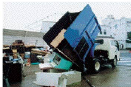
▲粗大ごみの中には多くの家電製品が含まれています

そこで、不用となった家電製品を環境に配慮して、有用な資源をリサイクルするために作った人、売った人、使った人が、それぞれの役割を果たしながら処理する仕組みとしてできたのが家電リサイクル法(特定家庭用機器再商品化法)です。