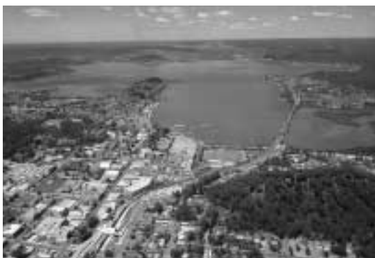
人口約15万人、面積1,029 のリゾート地

姉妹市 平成12年度野村・立井国際交流基金事業 ゴスフォード市への区民訪問団員募集 身近な国際交流に関心をお持ちのあなた、区民訪問団の一員として親善交流を体験してみませんか。 訪問期間 8月25日~9月1日の8日間(ホームステイ泊を含む) 訪問先 ゴスフォード市、シドニー市(オーストラリア) 主な交流予定 ゴスフォード市長表敬訪問/ホームステイ(下は除く) 応募資格 次の要件をすべて満たしている方(高校生以下は除く) 地域やサークルなどの文化・スポーツ活動で、本区の文化および住民性の向上に積極的に貢献しており、帰国後、その成果を活かし本区の国際化の推進と地域文化の向上のために活動できる区民(在勤者を含む) 訪問のための学習会・ミーティング・報告会などの全日程に参加できる方 健康で、団体行動に適応できる方 応募方法 次の書類を文