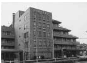
ひまわり 東 西8-19-16 (5658) 5111