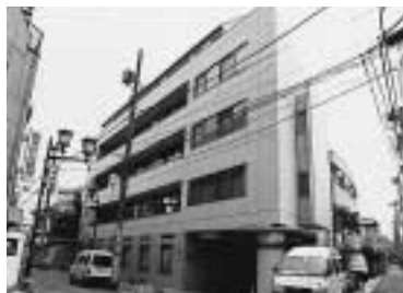
いらい敬愛園 南小岩8-13-5 (5693) 3341