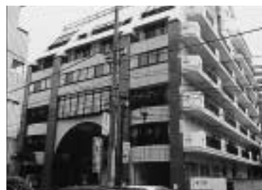
ビーバス成光苑 北小岩2-7-6 (5612) 7018