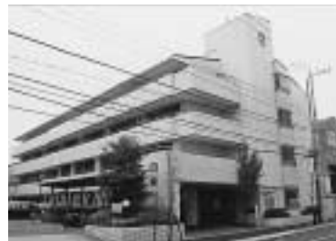
ヴィット 船堀3-10-7 (5696) 3363