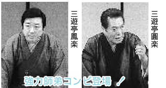
強力師弟コンビ登場!