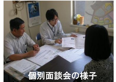
個別面談会の様子