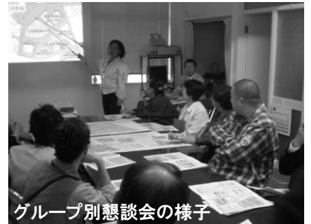
グループ別懇談会の様子

当日、話し合われた内容につきましては2面にまとめを掲載しておりますのでご覧ください。