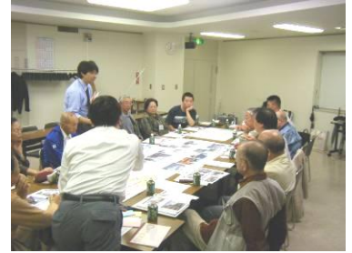
第12回勉強会の様子 (11/20)