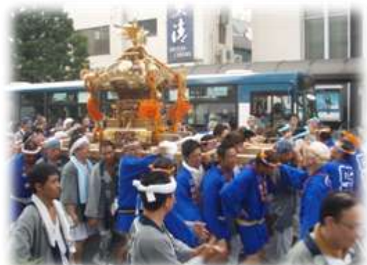
四南の大みこし(駅前ロータリーにて)