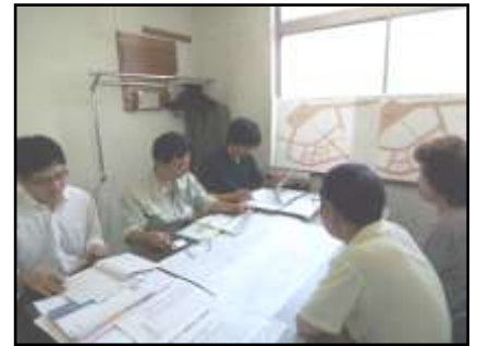
写真：個別面談の様子

今回の個別面談会に限らず、個々のご相談については、これからも随時行っていきます。まだ面談を行われていない方や、もう一度面談をご希望される方は、区担当者までご連絡をお願いします。（連絡先は最後のページにあります）