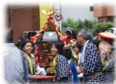
子どもみこしと太鼓山車(駅南)