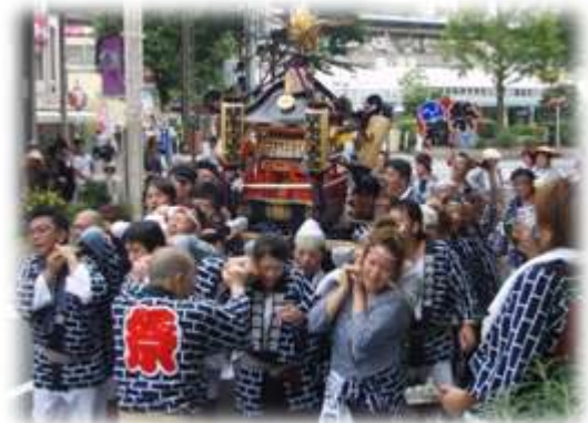
駅南の大みこし(フラワーロードにて)