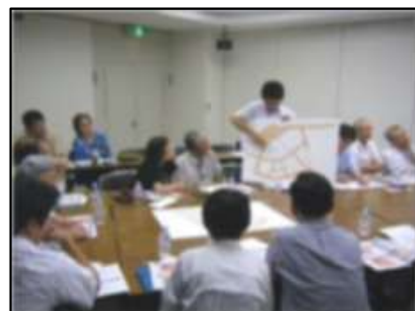
写真：勉強会の様子（7/27）

これからは、皆さんの土地利用の意向を踏まえながら、より具体的なまちのイメージや事業計画について議論を行っていく予定です。