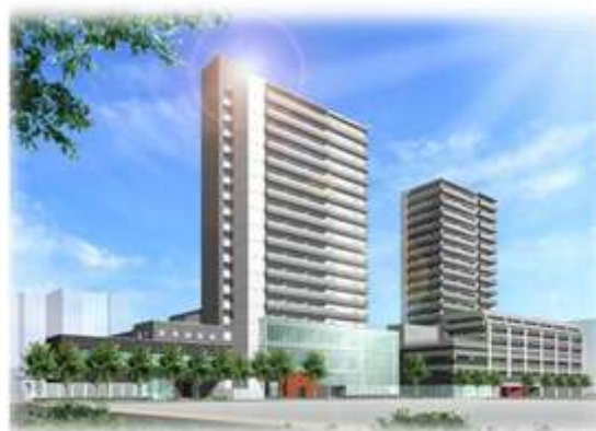
篠崎駅西部地区で完成した「篠崎駅西口公益複合施設」

勉強会では、皆様方のご意見・ご要望をまちづくりに反映していく絶好の機会です。より多くの方の積極的なご参加をお待ちしております！