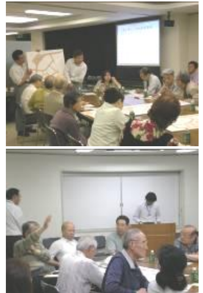
写真：勉強会の様子（6/22）