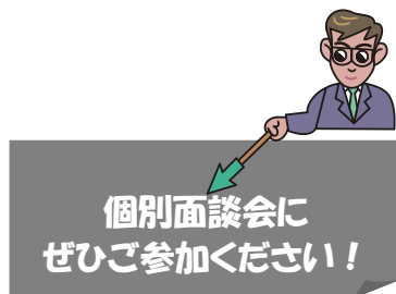
図：個別面談会の開催日程