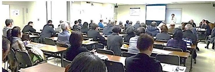
前回のまちづくり説明会（平成25年3月・4月開催）

JR小岩駅周辺地区におけるまちづくり説明会（開催：江戸川区）が10月下旬に予定されています。内容は、今年度末、都市計画決定を予定している道路・交通広場・地区計画・新たな防火規制についてです。