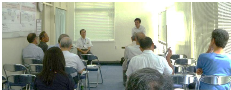
《見学会後の意見交換の様子》