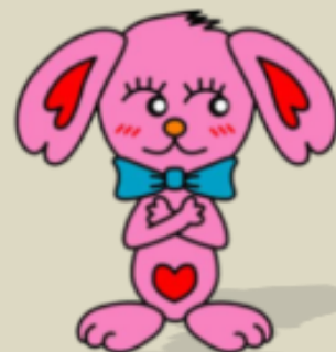
小岩のまちづくり キャラクター こいワン

※これまでのまちづくりについては、江戸川区のホームページでご覧になれます。 http://www.city.edogawa.tokyo.jp/gyosei/toshikeikaku/koiwaekishuhen/index.html