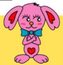
小岩のまちづくりキャラクター こいワン