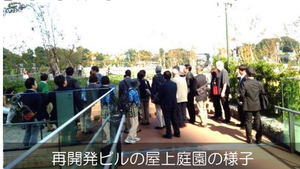
再開発ビルの屋上庭園の様子

蒲田駅周辺の「さかさ川通り」のイベントでは、道路が活用されており、この事例を参考に小岩でも同様のイベントが開催できると良いという意見が多数寄せられました。