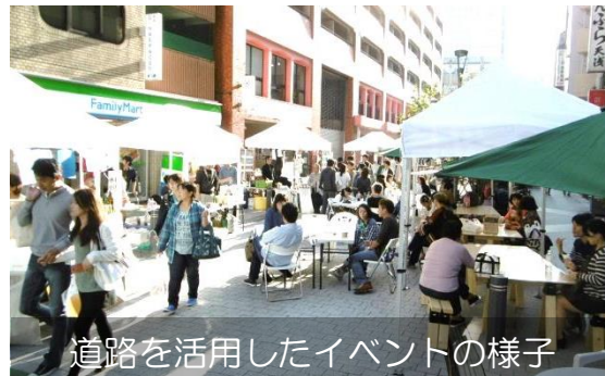
道路を活用したイベントの様子

質問：七丁目地区（上図C）の土地区画整理事業と市街地再開発事業はどのように行うのですか。