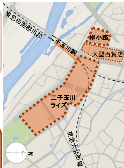
二子玉川駅周辺の地図