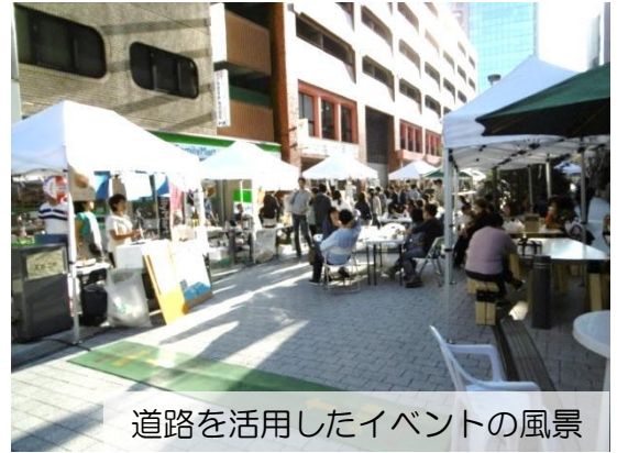
道路を活用したイベントの風景

※特区会議で認定されることにより、道路の占用許可基準が緩和され道路でイベント等の開催がしやすくなる。