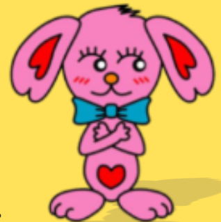
小岩のまちづくり キャラクタ こいワン

※これまでのまちづくりについては、江戸川区のホームページでご覧になれます。 https://www.city.edogawa.tokyo.jp/kankyoto/toshikeikaku/koiwaekishuhen/index.html