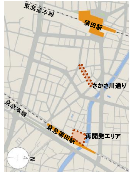
蒲田駅周辺の地図