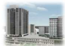
事業協力者提案(2017.10)に基づくイメージ