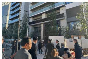
線路側（北側）から敷地内へ