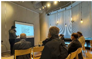
総括工事長による概要説明