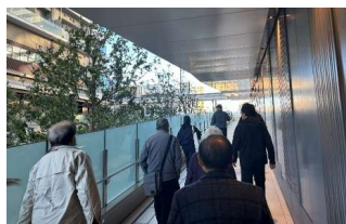
公共駐輪場からフラワーロード側へ向かうペDESTリアンデッキ