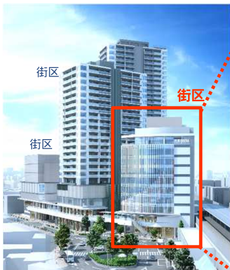
南小岩六丁目地区再開発 イメージ図

建物概要については、地上10階建ての鉄骨造で、建築面積は約850㎡、延床面積は約7,100㎡です。また商業店舗は、1階にカフェ・まち運営団体拠点（詳細は次ページ）、2階に携帯ショップ・薬局等、3階に飲食店、4階にネットカフェ、5階にクリニックモール、6階から8階にフィットネスクラブ、9・10階にオフィスの構成となっています。