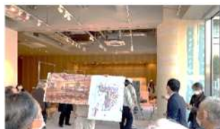
1階 カフェ・まち運営団体拠点