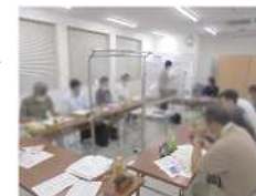
準備会開催の様子

令和2年1月より、南小岩六丁目地区、JR小岩駅北口地区、南小岩七丁目地区の市街地再開発組合・準備組合と、まちづくり協議会から選出されたメンバーで準備会を立ち上げ、エリアマネジメントの検討を開始しました。計9回にわたって実施した準備会では、まち運営団体の組織構成、活動目的、団体の名称等、まち運営に係る様々な事項について意見交換を行い、令和2年11月16日に「一般社団法人小岩駅周辺地区エリアマネジメント」が設立されました。