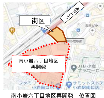
南小岩六丁目地区再開発 位置図