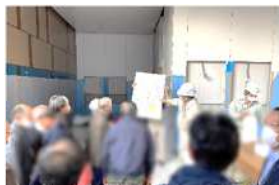
1階 エレベーターホール