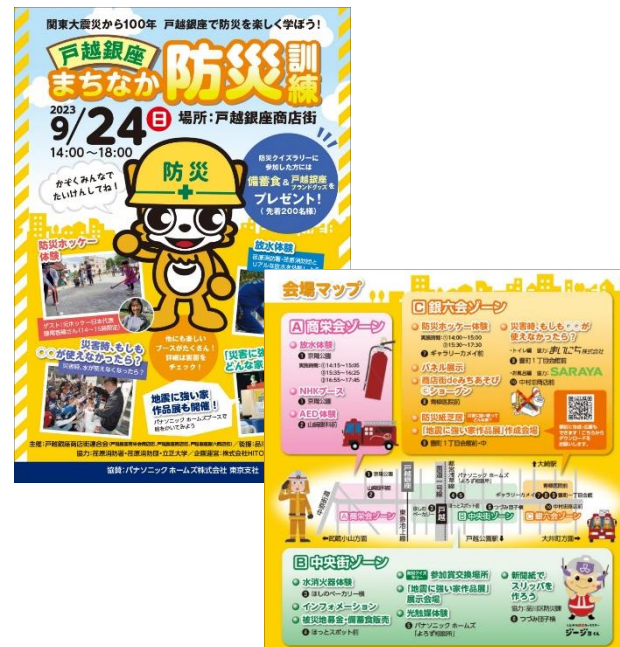
（イベントパンフレット）

A. 参加者は子ども連れの若い方が非常に多いが、イベントの開催側は40代以上が多い印象である。今後若い方の参画を進めたいと思っている。また5月のイベントは、徒歩15分圏内の居住者が約76%と周辺からの参加が多い。（アンケートより）