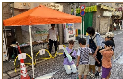
体を動かして防災を学ぶ 防災ホッケー体験