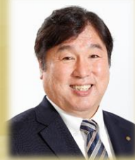
江戸川区長 齊藤 猛

引き続き、区民の皆様の一層のご理解とご協力をお願い申し上げ、まちづくりに向けてのご挨拶とさせていただきます。