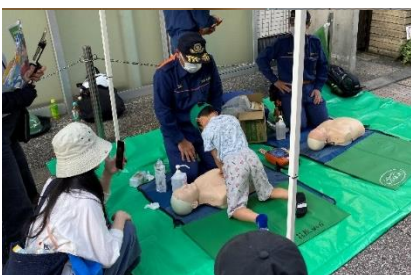
消防団と連携したAED体験