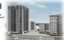
事業協力者提案(2017.10)に基づくイメージ

環境アセスメント調査は、調査計画書の公告・縦覧を行い、その後各種影響調査を実施しました。