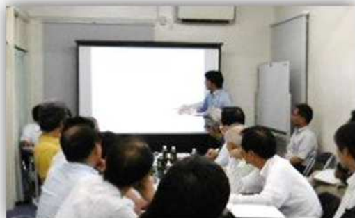
8月26日の発起人準備会での検討の様子