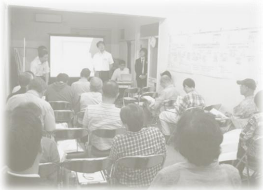
第1回合同研修会 6月16日

勉強会での検討と並行して、再開発に関する基礎知識を身につけるために、研修会をスタートしました。この研修会は、631地区と合同で開催しており、地区間交流の場となっています。