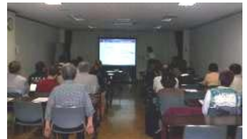
写真：懇談会の様子（10/29）