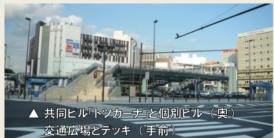
▲ 共同ビル「トツカーナ」と個別ビル（奥） 交通広場とデッキ（手前）

来年2月9日に、戸塚の視察会を予定しています！小岩のまちづくりにとても参考になるので是非ご参加ください。詳しい情報が決まり次第またご連絡します！