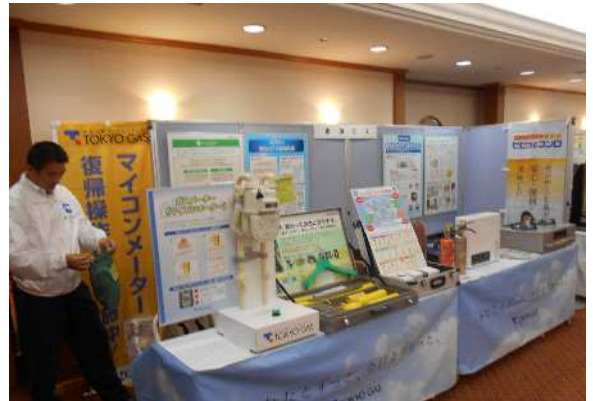
暮らしの情報コーナー