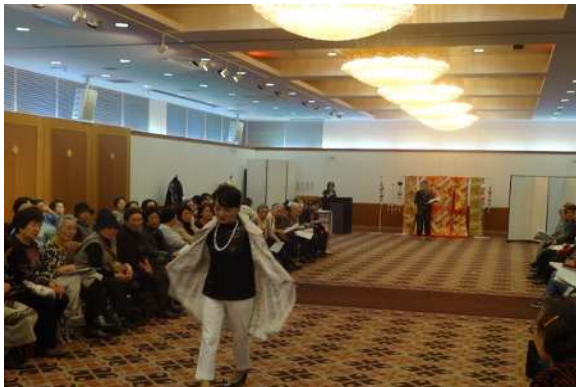
和服のリフォームファッションショー(あじさい)