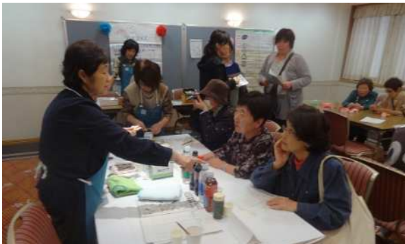
飲料の糖度調べ(江戸川区消費者団体連絡会)

10月28日(金)、グリーンパレスにて、消費生活展「くらしフェスタ2016」を開催し、350人の方々にご来場いただきました。会場内では、～手をつなごう消費者の輪(わ)～をテーマに、消費者団体6団体による日頃の活動成果の発表や体験コーナー、関係機関3団体による、暮らしに役立つ展示や相談コーナーが設けられました。ご来場いただいた皆様ありがとうございました。