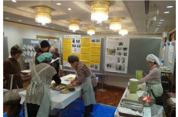
小松菜入り豆乳のスムージー(ACサークル)