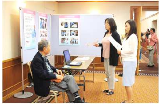
江戸川みまもり隊ブース