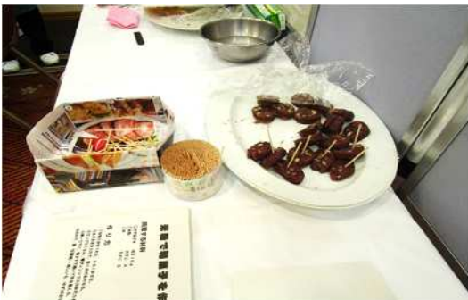
米粉で作る和菓子試食コーナー