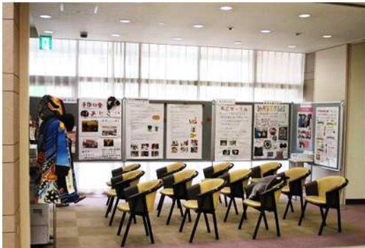
グリーンパレス1階ロビーPRコーナー

消費者団体7団体による催しや活動成果の発表・体験コーナーが実施・展開されました。また、関係機関による暮らしに役立つ展示や相談コーナーも設けられました。台風21号の影響で雨天にもかかわらず、ご来場いただきました皆様、ありがとうございました。