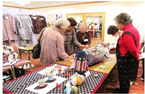
昔の着物、生地を利用したパッチワーク等の展示