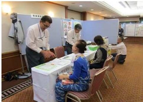
関東電気保安協会ブース