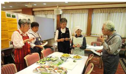
小松菜とリンゴのサラダ試食コーナー