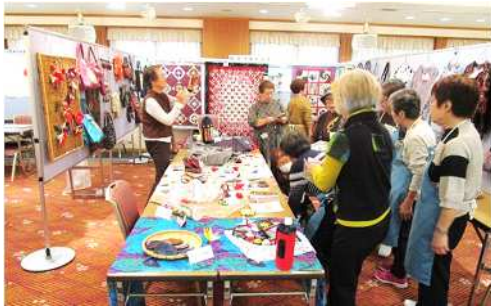
昔の着物、生地を利用したバッグ等の展示