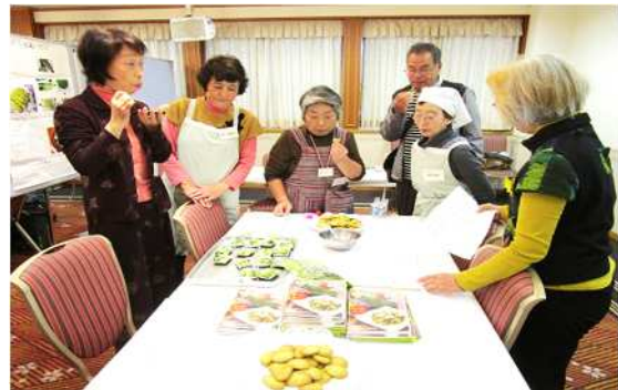
小松菜クッキー試食コーナー