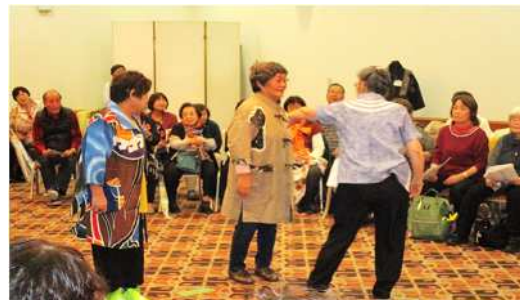
リフォームファッションショー