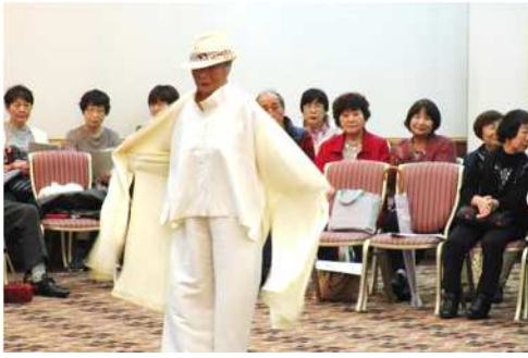
リフォームファッションショー