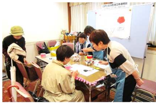
ガムテープで作るコサージュ