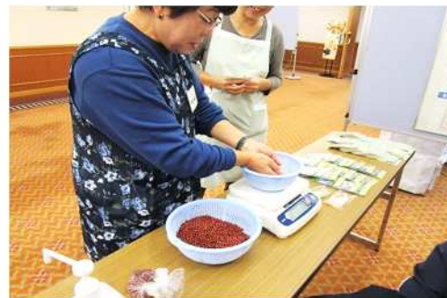
消費者センター(計量コーナー他)