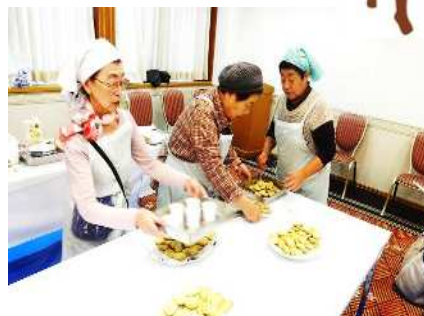
小松菜入りクッキーの試食