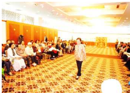
手作りファッション・ショー