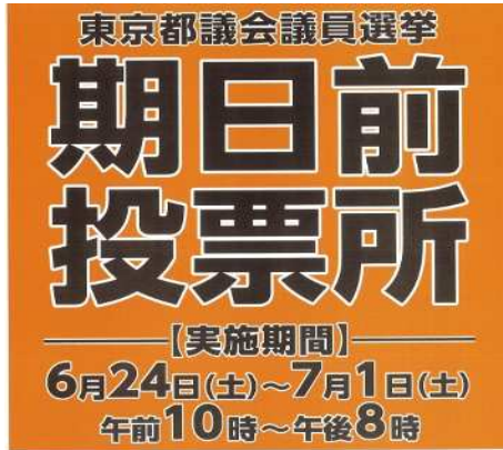
床シール (イトーヨーカドー葛西店)