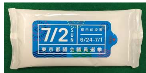
ウェットティッシュ