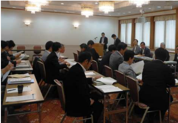
立候補予定者説明会