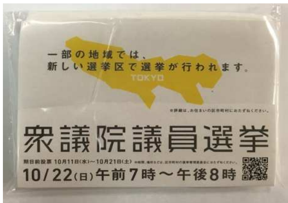
啓発用ティッシュ