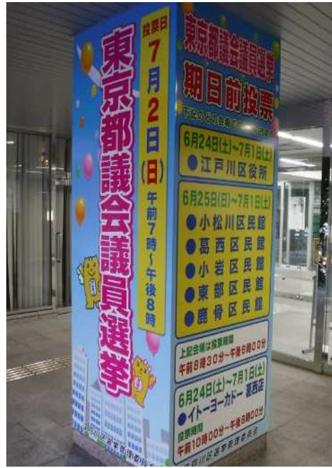
柱巻きサイン (江戸川区役所)