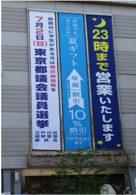
懸垂幕 (イトーヨーカドー小岩店)