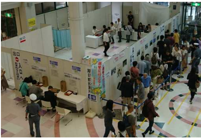
期日前投票所 (イトーヨーカドー葛西店)