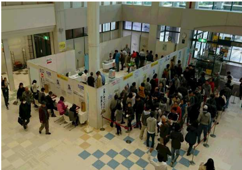
イトーヨーカドー葛西店(期日前投票)