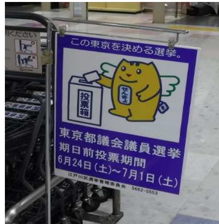
啓発用オリジナルポスター (イトーヨーカドー葛西店)