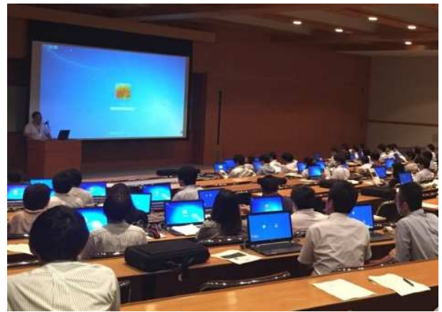
当日投票システム説明会