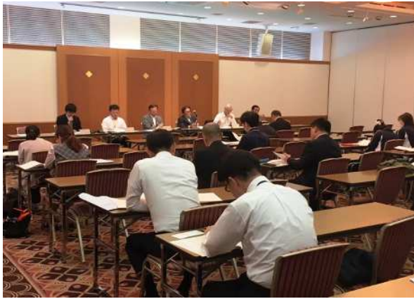
不在者投票指定施設の説明会