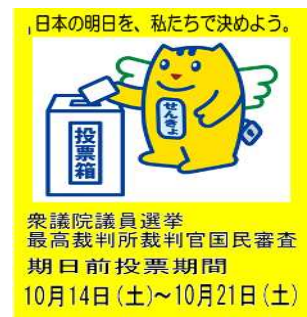
オリジナルポスター (イトーヨーカドー葛西店)