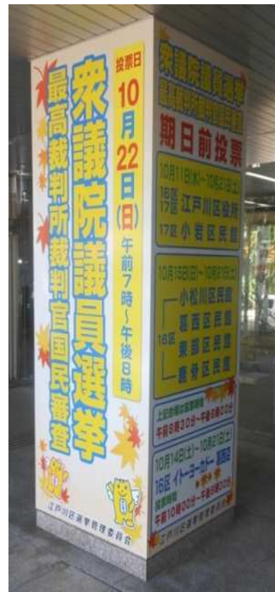
柱巻きサイン (江戸川区役所)