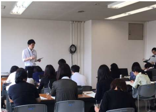
名簿対照係説明会(期日前投票)