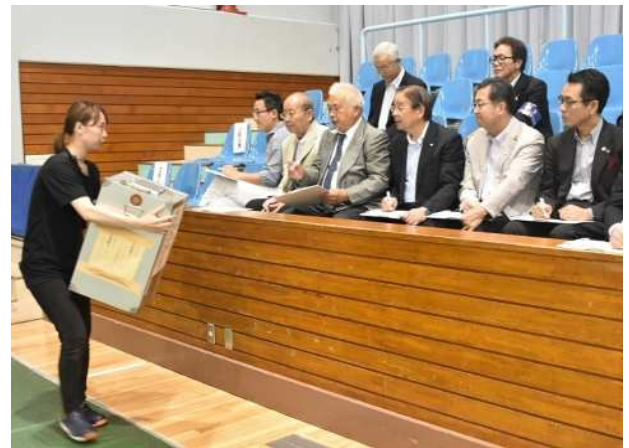
投票箱の搬入(開票所)