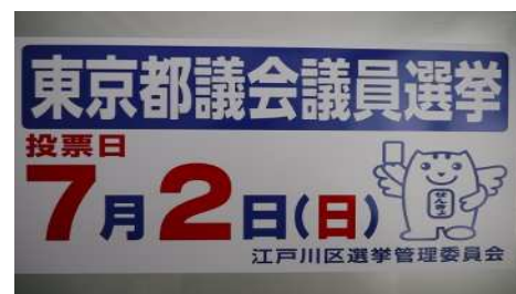
啓発用マグネットシート