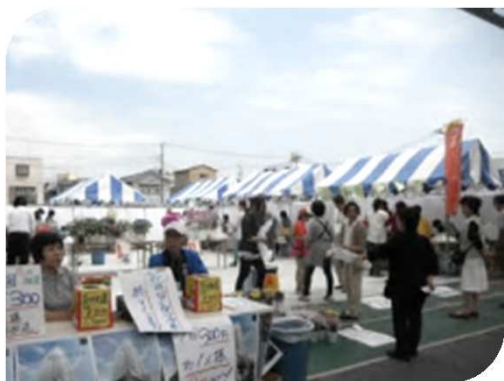
▲七丁目西地区の会場の様子

また、今年は、現在工事中の七丁目西地区の一部スペースが開放され、抽選会や模擬店の会場として活用されていました。限られたスペースではありましたが、フラワーロードを通行する人々も自然と会場に足を運び、大変にぎわっていました。