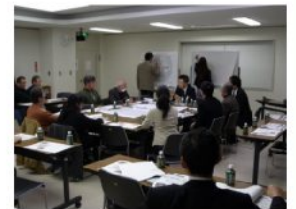
▲第2回景観デザイン部会の様子

これまでに4回の部会を開催し、景観まちづくりで残したい風景や工夫したいことなどについて意見交換を行いました。また、これまでの意見やアイデアをもとに、小岩駅周辺地区の《景観デザインの方向性とルール》についても検討しています。