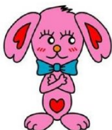
小岩のイメージキャラクター 「こいワン」