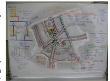
▲意見やアイデア等のまとめ図

今回の景観デザイン部会については、他の部会の活動動向にあわせて開催する予定です。