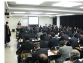
▲第1回商業・住宅部会の様子