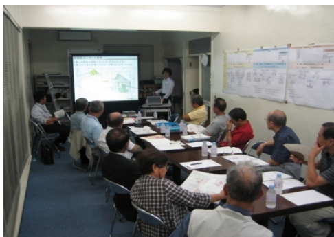
少しずつ、具体化してきました!