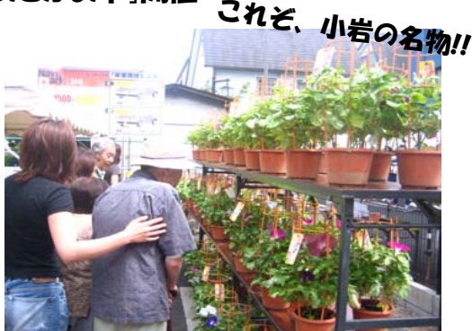
これぞ、小岩の名物!!