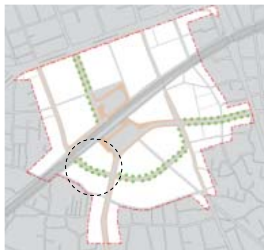
まちづくり構想図（案）

6月27日は線路側に権利をお持ちの方（Bグループ）、7月1日は商店街側に権利をお持ちの方（Aグループ）にそれぞれお集まりいただき、いずれも活発な議論が展開しました。