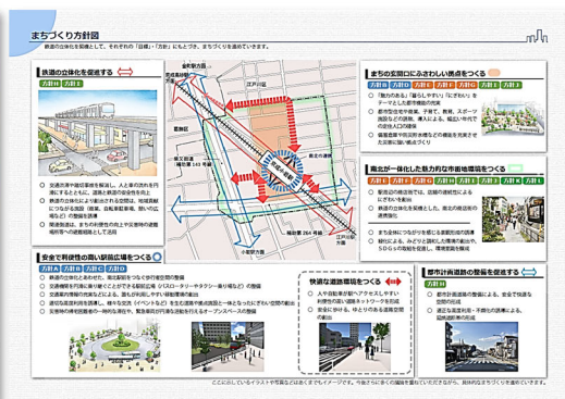
まちづくり方針図

区ホームページに、「まちづくり基本計画」や、これまでの経緯などを掲載しています。ぜひご覧ください。