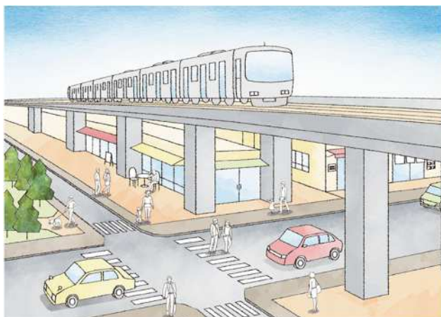
連続立体交差事業を契機としたまちづくり （まちづくり基本計画（素案）より）