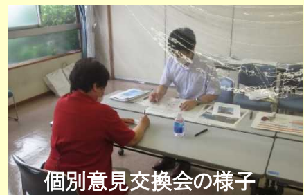
個別意見交換会の様子