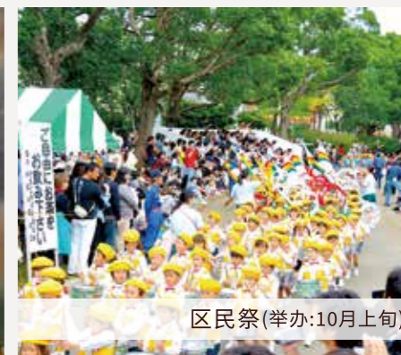
区民祭(举办:10月上旬)