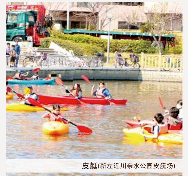
皮艇(新左近川亲水公园皮艇场)