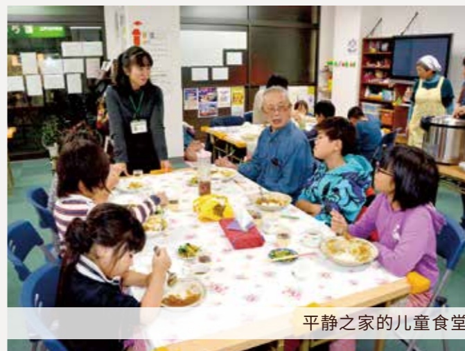
平静之家的儿童食堂