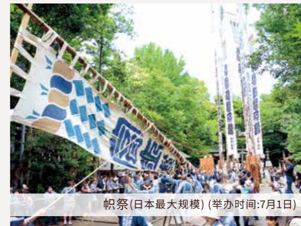
帜祭(日本最大规模)(举办时间:7月1日)