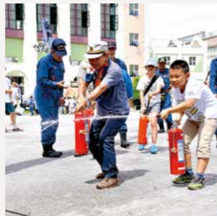
小松川平井地区防灾训练