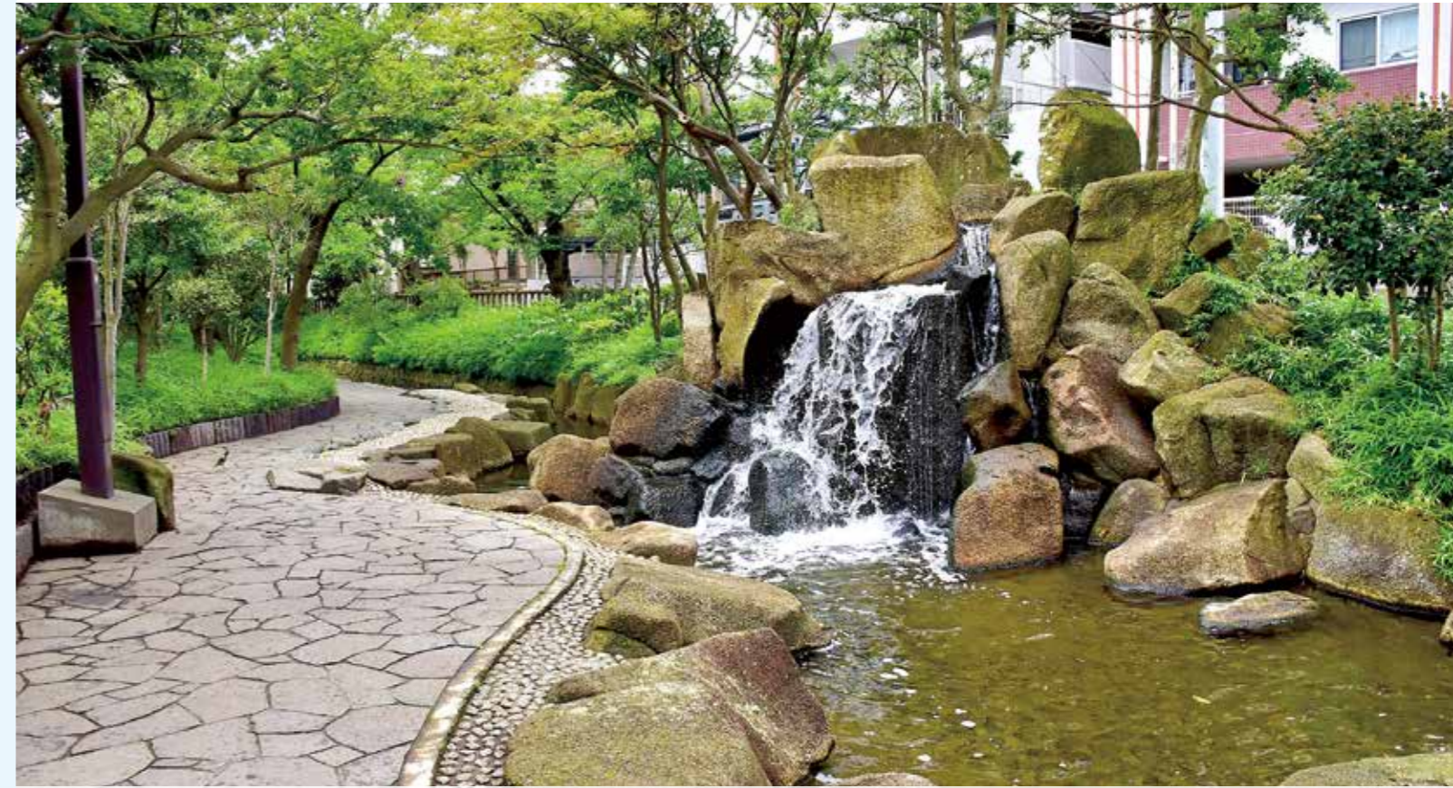
古川亲水公园(日本首个“亲水公园”)

2021年5月，江戸川区被选定为为了达成SDGs而进行出色努力的自治体“SDGs未来城市”。