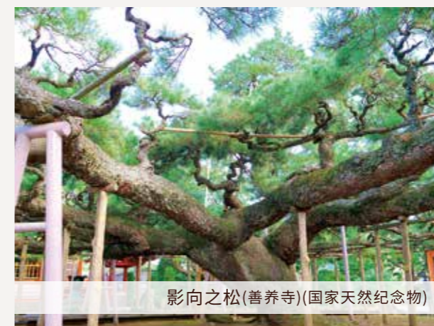
影向之松(善养寺)(国家天然纪念物)