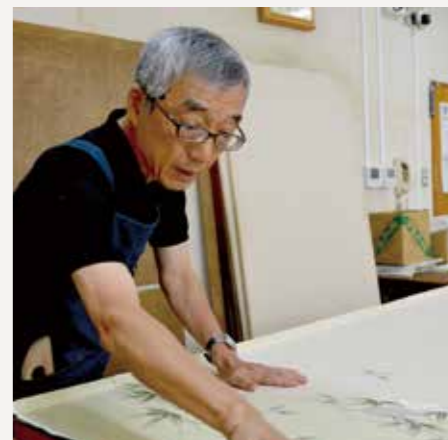
全日本首个老年人事业团成立(现银色人才中心)