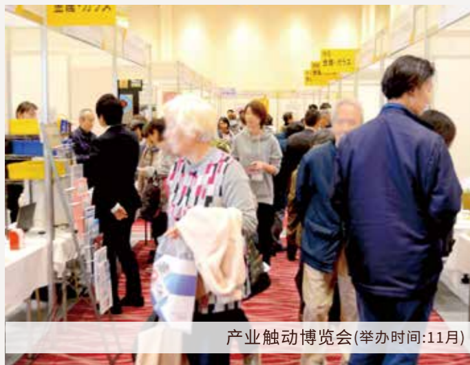
产业触动博览会(举办时间:11月)