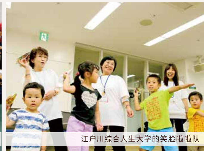
江戸川综合人生大学的笑顔啦啦队