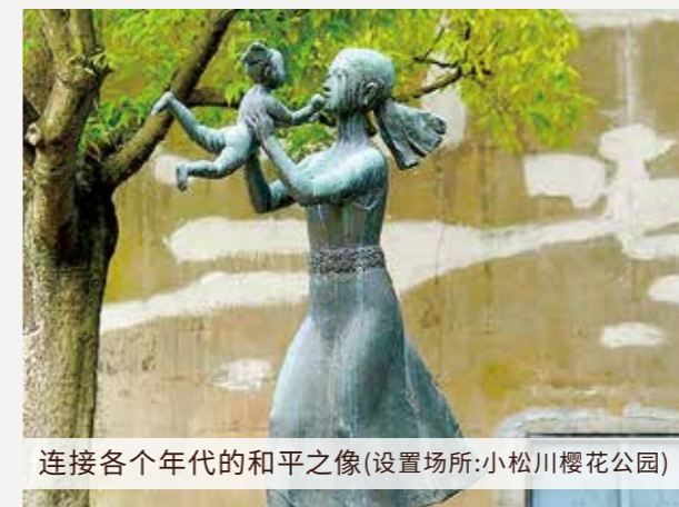
连接各个年代的和平之像(设置场所:小松川樱花公园)