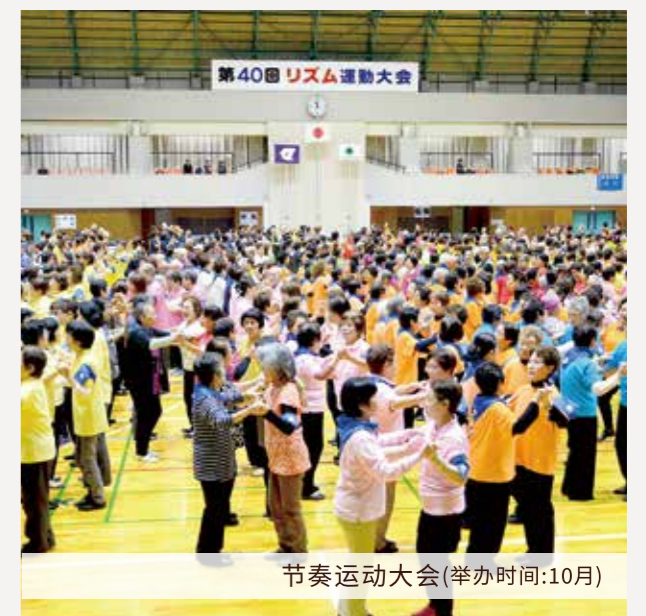
节奏运动大会(举办时间:10月)