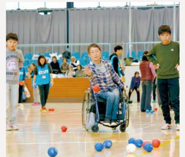
地板滚球(比赛地点:综合体育馆等)