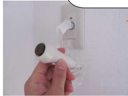
緊急通報ボタン（例）

居室・浴室・トイレなどに緊急通報ボタンを設置しています。通報時には警備員などが駆け付けます。