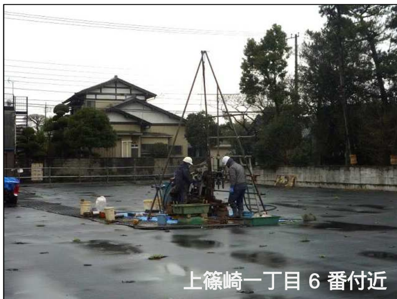
上篠崎一丁目 6 番付近

前回実施したボーリング調査に引き続き、詳細な土の性質を把握するため上篠崎一丁目 6 番付近及び三丁目 17 番付近においてボーリング調査を実施しました。