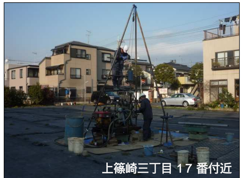
上篠崎三丁目 17 番付近