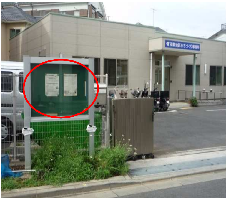
掲示場所：篠崎地区まちづくり事務所掲示板