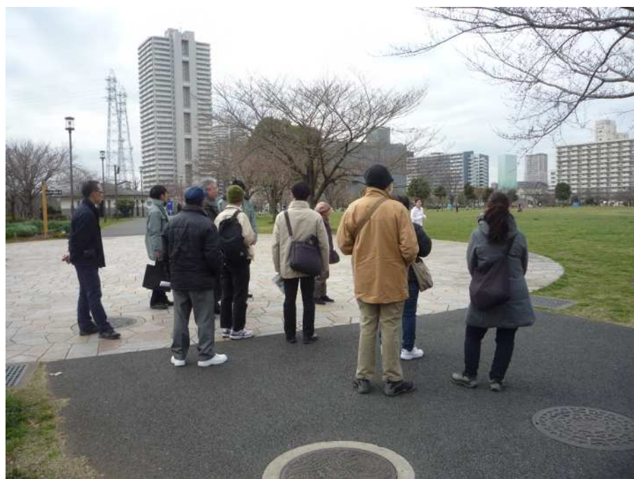
（上写真）大島小松川公園見学写真