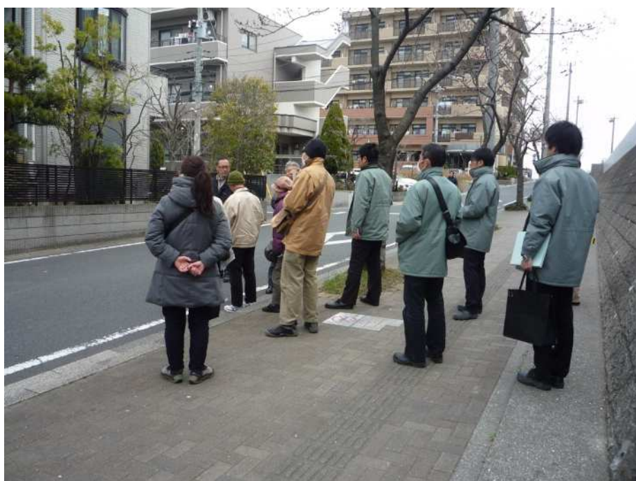
（上写真）妙典地区見学写真

今回で予定していた4回の準備会が終了し、活動目的を達成したということで準備会活動方針に則り、会は解散となりました。今後は、地区内の皆さまとともにお話し合いを重ねながら進めていきたいと考えています。