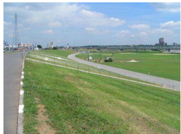
緩やかな堤防、緩やかな階段（江戸川病院前）