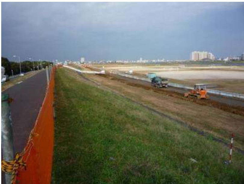
篠崎地区、現在工事中

なお、この緩傾斜堤防は、今後進めていく超過洪水対策であるスーパー堤防と一体的となることにより、より安全で強固な堤防となります。また、スーパー堤防工事により、再度工事することはありません。