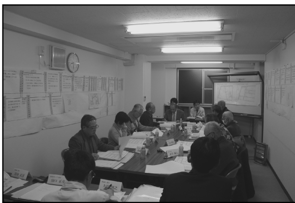
【土地区画整理審議会の様子】