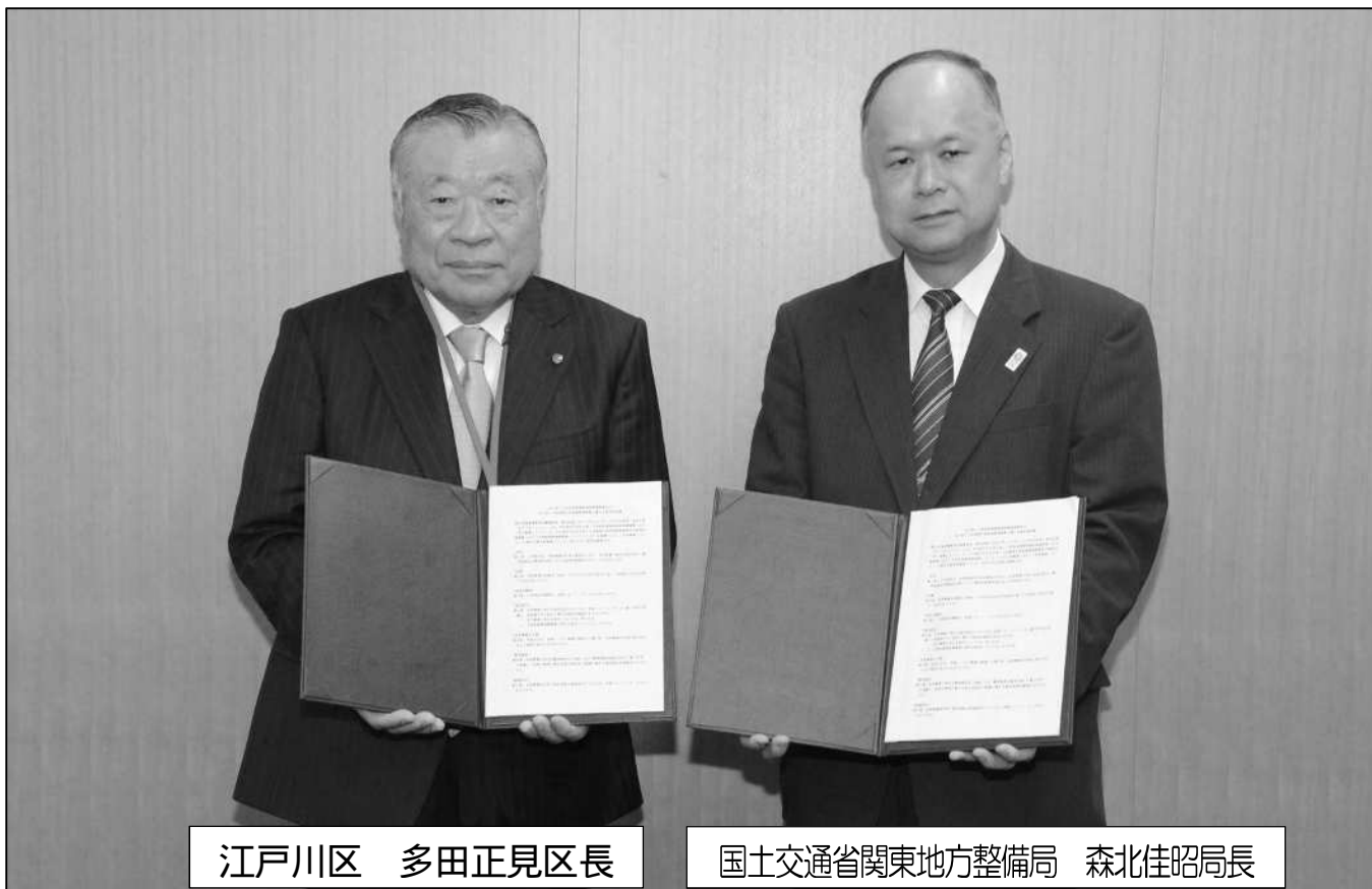
江戸川区 多田正見区長

そこで、改めて事業内容の説明を行うため、第18回まちづくり懇談会を開催します。開催の概要につきましては、今号のまちづくりニュースの裏面にて掲載していますので、ご確認ください。