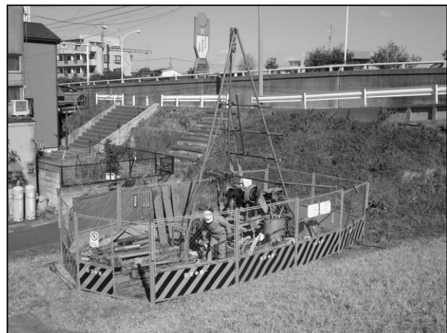
ボーリング調査の状況