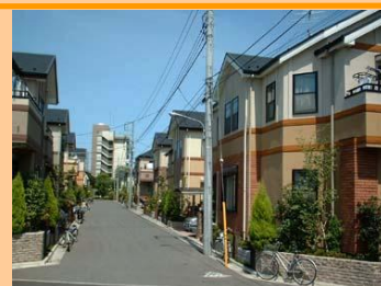
安全・災害につよい