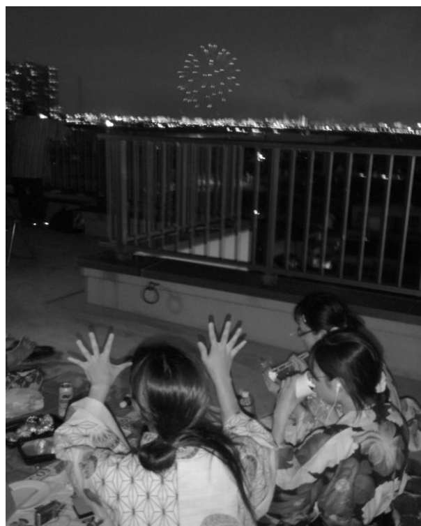
※昨年のも事務所屋上からの花火の様子