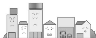
緑が少なく雑然とした沿道にうらおいを持たせません

道路や隣地から建物の壁面を離すことで、延焼の防止やゆとりのある街並みができます。