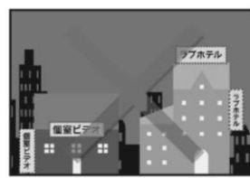
周辺の環境に悪影響を及ぼす建物を規制

ラブホテルやパチンコ店等、地区に好ましくない建物の建築を規制し、地区の目指すまちの環境ができます。