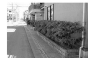
建物の後退により沿道緑化されたまちなみ