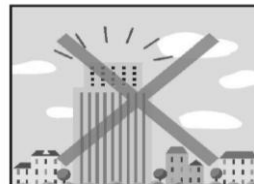
周辺のまちなみを壊す高い建物を規制します