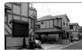
広くて余裕のある敷地