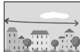
連続した統一感のあるまちなみ