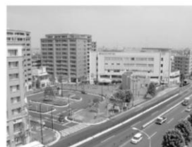
環境が守られた駅周辺