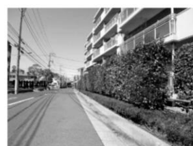
生け垣のある敷地