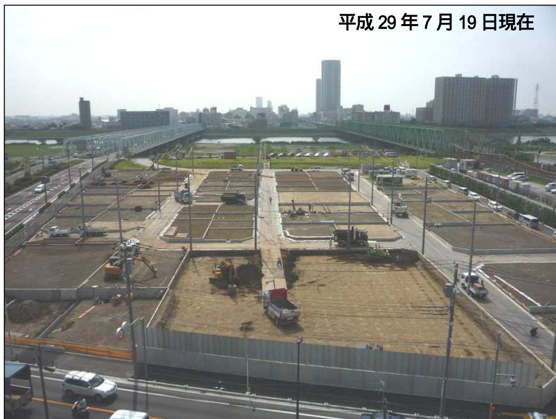
土地の引渡しに向けたスケジュール