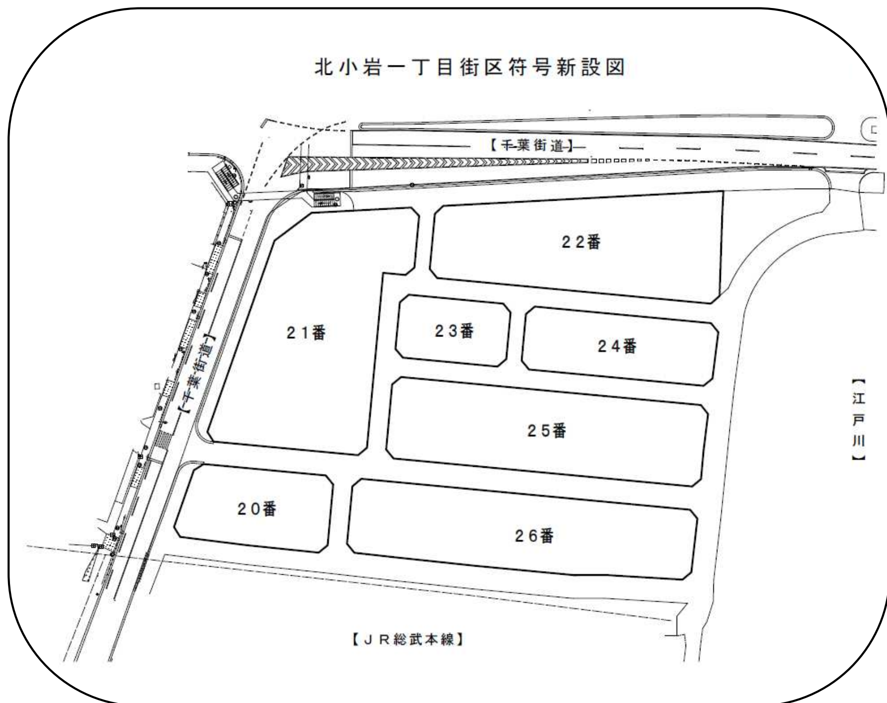
北小岩一丁目街区符号新設図

平成28年12月1日(木)に住居表示の公告がされました。地区内は現在造成工事中ではありますが、下図のように街区に番号が割当てられました。