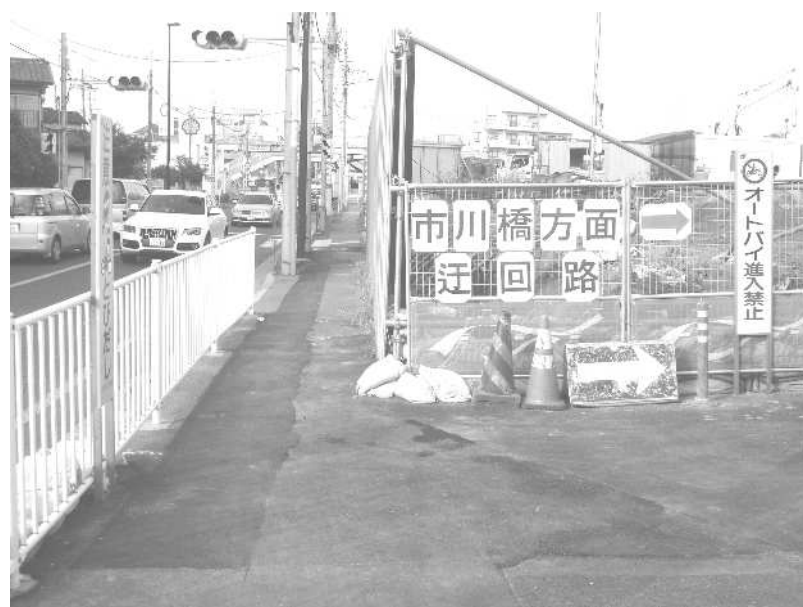
迂回路（千葉街道側）