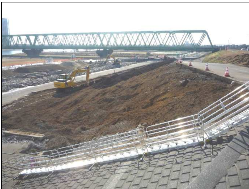
江戸川の高水敷側の緩傾斜堤防整備の状況です(平成28年1月15日現在)

平成27年12月上旬から3期工事に入り、高規格堤防と江戸川高水敷側の緩傾斜堤防の工事を進めています(施工会社:共立建設株式会社)。今回、作業ヤードの関係で見学デッキ等を設置していませんが、沈下観測データについては引き続き現地に掲示しています。