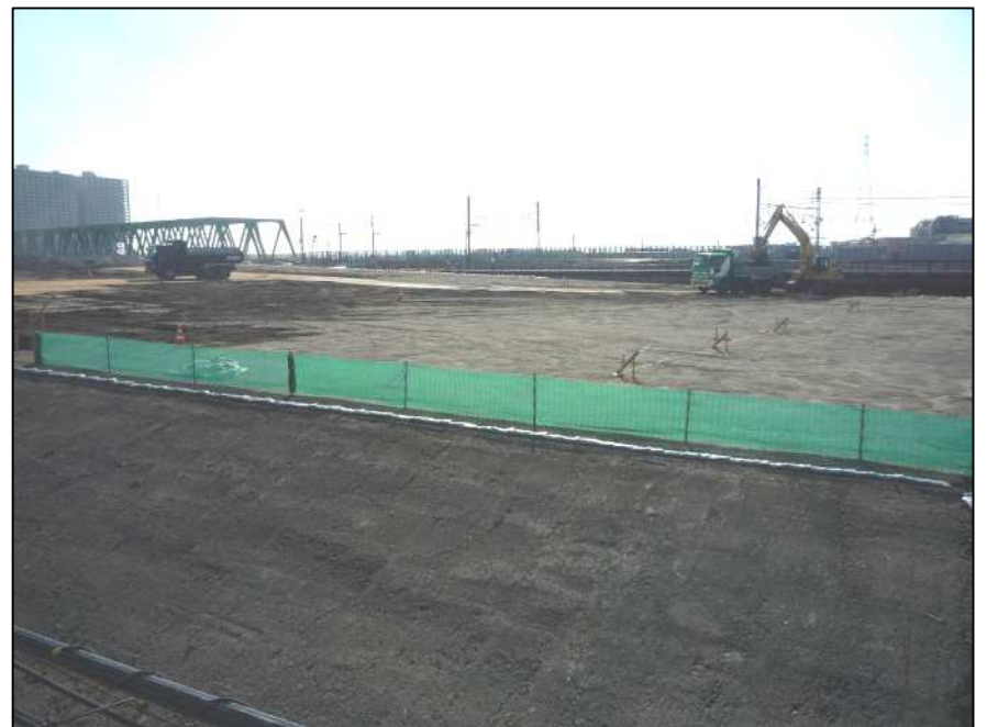
高規格堤防整備の状況です(平成28年1月15日現在)