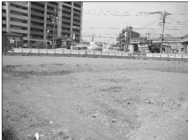
旧 北小岩一丁目東部地区まちづくり事務所周辺