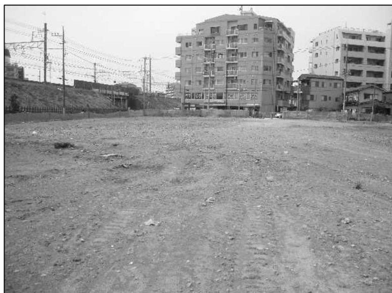
千葉街道（地区南西側）を臨む