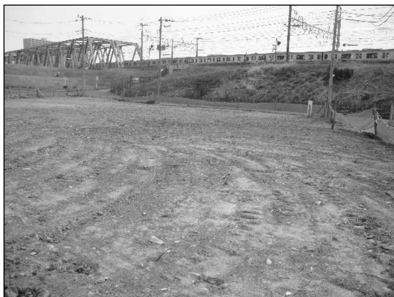
江戸川、JR 総武本線（地区東南側）を臨む